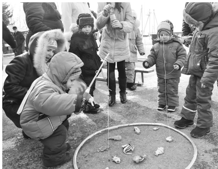
На ярмарке играли...