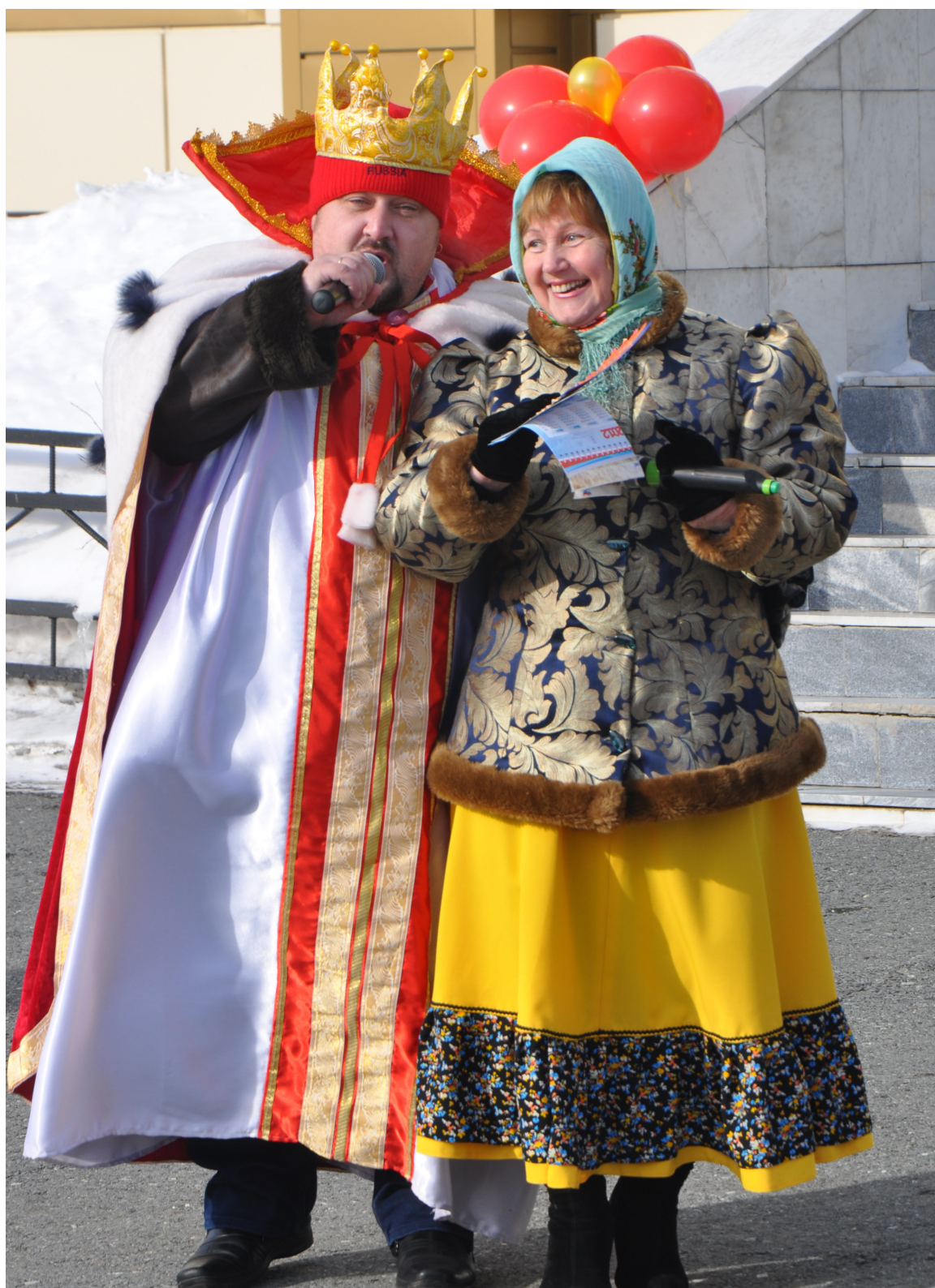
Пока честной народ гулял и веселился, Царь Глухарь и Болтушка весну от сна будили