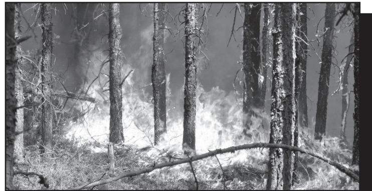
За 2012 год на территории Юргинского района ликвидировано 23 лесных пожара