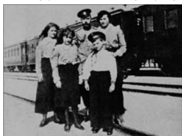
Николай II с детьми

ВНИМАНИЕ! Седьмой вопрос викторины О ком из рода Романовых сам патриарх Цареградский писал: «Редко самого мужа благочестивее украшают четыре главные добродетели: теплая вера, разум, мудрость, целомудрие, ты обладаешь ими всеми...»? ЖЕЛАЕМ УСПЕХОВ!