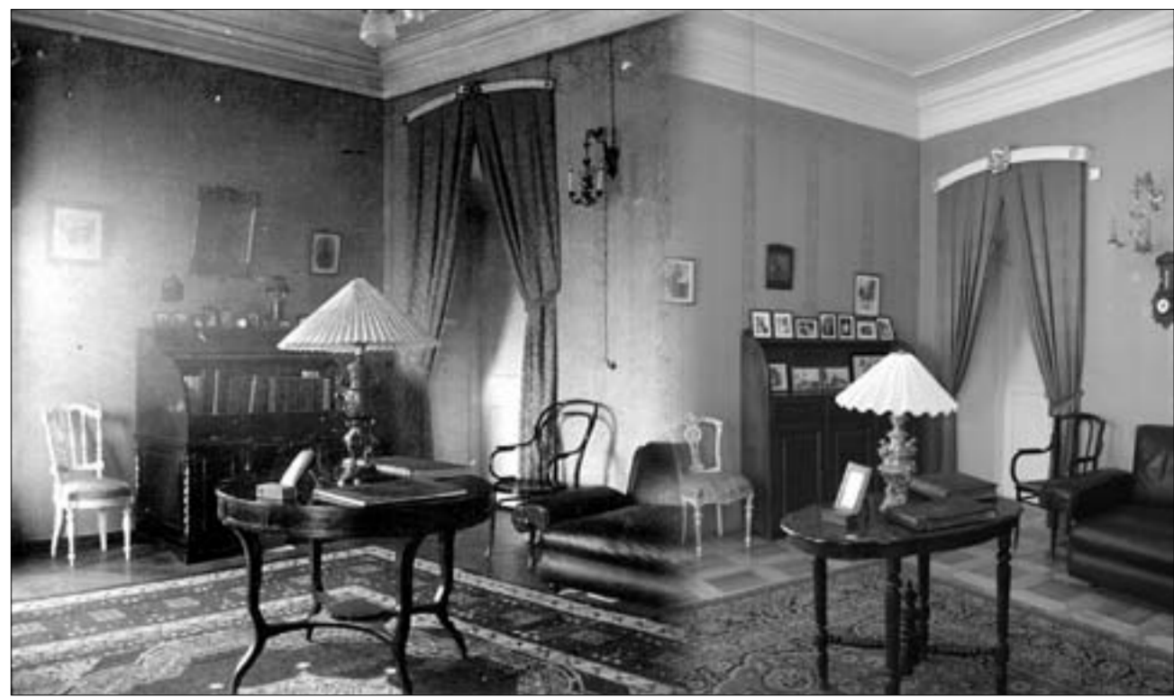
Кабинет императора (слева – ещё при жизни, справа – XXI век)

Здесь в августе 1917 года по решению Временного правительства оказались последний российский император вместе с женой, детьми и преданными ему людьми. Сегодня здание, расположенное в нижнем посаде и знакомое всякому проезжающему через Тобольск человеку, интересующемуся культурой и историей, в ожидании перемены. Теперь уже в XXI веке это архитектурное сооружение должно вернуться к прежнему своему статусу.