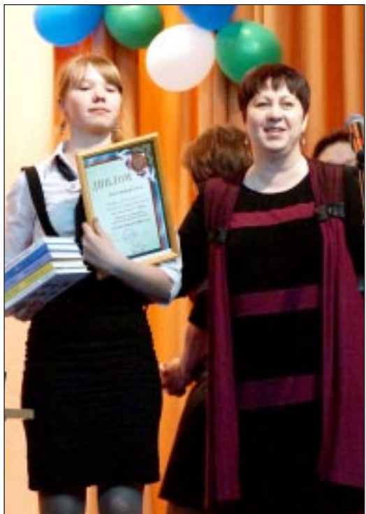
Диплом победителя вручили команде, представлявшей Алымскую сельскую библиотеку.

Во второй части данного этапа свои знания показывали капитаны сборных. По отрывкам из книги они