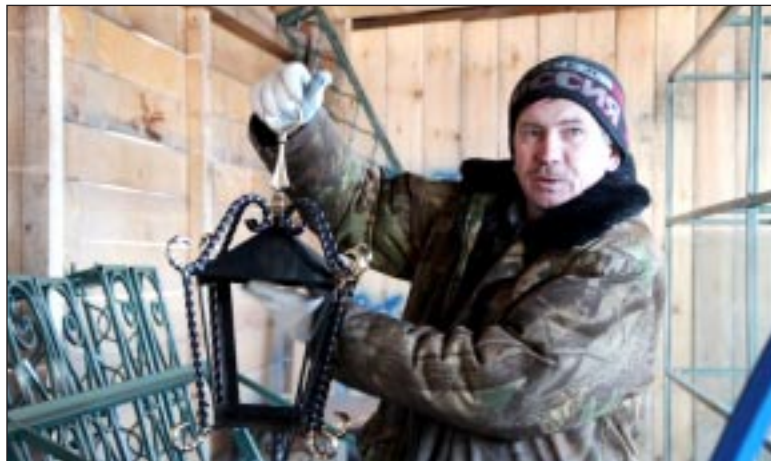
В складе готовой продукции.