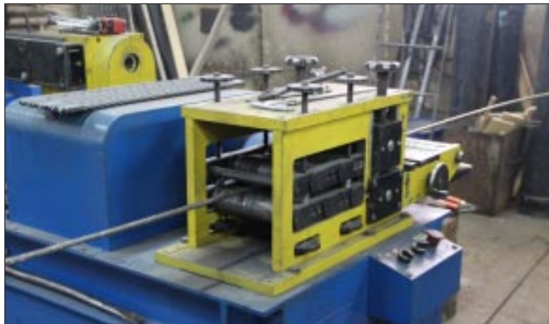
На пруток наносится узор.