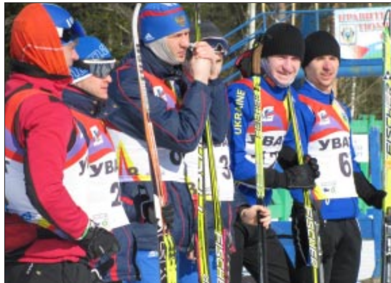
Построение перед началом цветочной церемонии.

Также неплохо заявили о себе турецкие участники: на их счету эста-