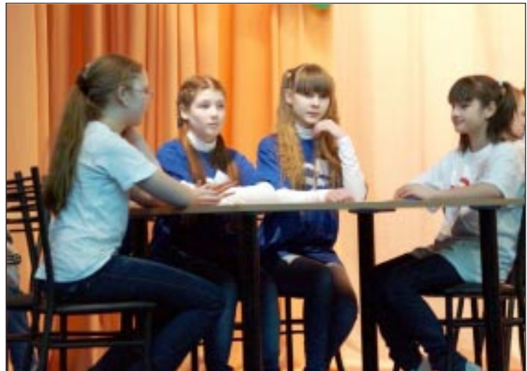
Команда «Доминаторы» из Демьянского.