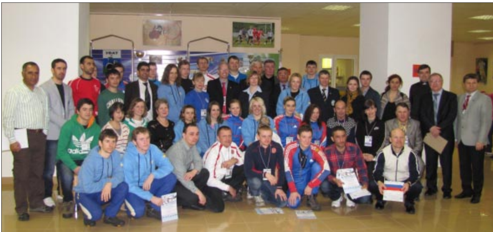
Чемпионат мира по лыжным гонкам среди спортсменов с нарушением слуха завершён. Фото на память.