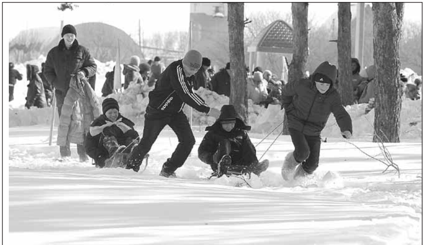
Зимние забавы на свежем воздухе.