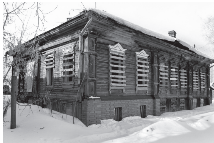
Дом по ул. Ленина, 23 расселён в прошлом году. Вскоре здание будет снесено, а на его месте и соседних участках начнётся строительство трёхэтажного жилого дома.