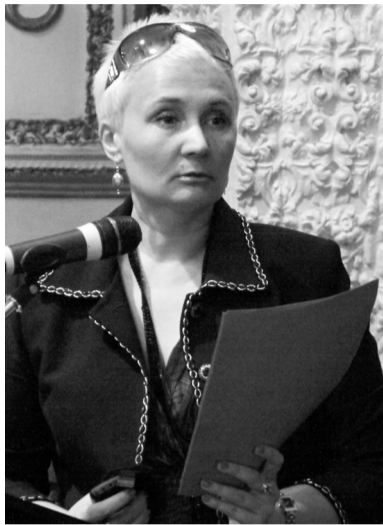
Ежегодно комиссия по делам несовершеннолетних проводит общегородской «Открытый микрофон», на котором специалисты различных ведомств, а также заместитель главы города по социальным вопросам отвечают на вопросы, касающиеся организации досуга подростков и защиты их прав.

За минувший год несовершеннолетние на территории города совершили 47 преступлений (в 2011-м зарегистрировано 56 случаев, основная масса правонарушений — имущественного характера). С каждым подростком проводят индивидуальную работу психологи и социальные педагоги, помогают вернуться к учёбе, устроиться на работу и организовать досуг. Ну а с теми, кому никакие меры не помогли, приходится решать вопрос кардинально: их направляют в спецучреждения закрытого типа (трое детей по решению суда были отправлены в СУВЗТ в 2012 году). Родителей, которые долгое время не могли справиться со своими прямыми обязанностями, для кого водка или любовь к новому супругу (и такое бывает!) оказались сильнее материнских или отцовских чувств, лишают прав (это также произошло в прошлом году трижды).