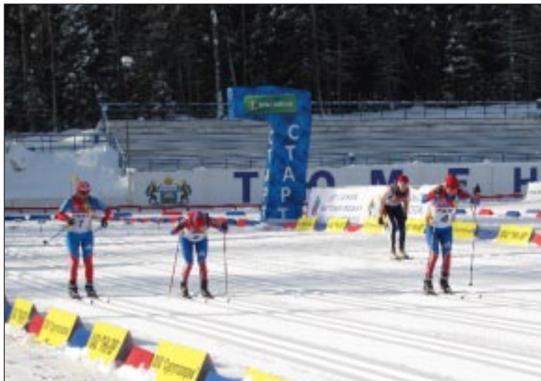
Классический этап женского дуатлона.

В соревнованиях приняли участие порядка 50 спортсменов. Но даже из такого небольшого числа лыжников-сурдлимпийцев нужно было выбрать сильнейших, тех, на кого возлагаются надежды на мировом старте. И хотя уровень подготовки российских лыжников традиционно высок, все-таки нам не хватает опоры в лице молодежи, которая будет отстаивать честь страны через год-другой или 10 лет.