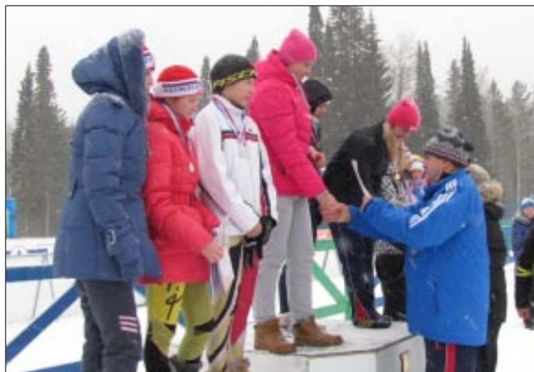
Награждение победителей и призёров эстафеты среди юниоров.

В общем зачете по всем видам гонок первое место среди взрослых спортсменов завоевали лыжники Коми, а среди юниоров – из Башкортостана. Вторыми идут команды ХМАО-Югры и Пензенской области, а третьими – Пермского края и Кировской области. Тюменцам же удалось подняться до четвертой строки турнирной таблицы.