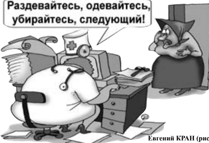
Евгений КРАН (рис.)