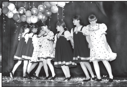
Группа «Real Dance» выступала вне конкурса