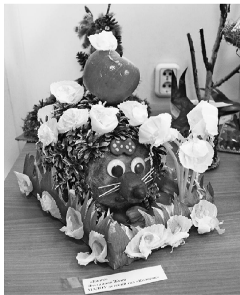
детей и детей.

В технике оригами можно выделить несколько работ, заслуживающих особого внимания. Это «Стая лебедей», а также корзины с цветами. Необыкновенно красивые, сложные по своей структуре поделки были выполнены из природного материала, это «Тетушка сова», «Весна в лесу», «Ежик», «Скворечник», а также «Чайные розы», вырезанные из свеклы. Привлекают к себе внимание поделки из бисера, макаронных изделий, мягкая игрушка. Все представленные на конкурс работы — это колоссальный труд ро-