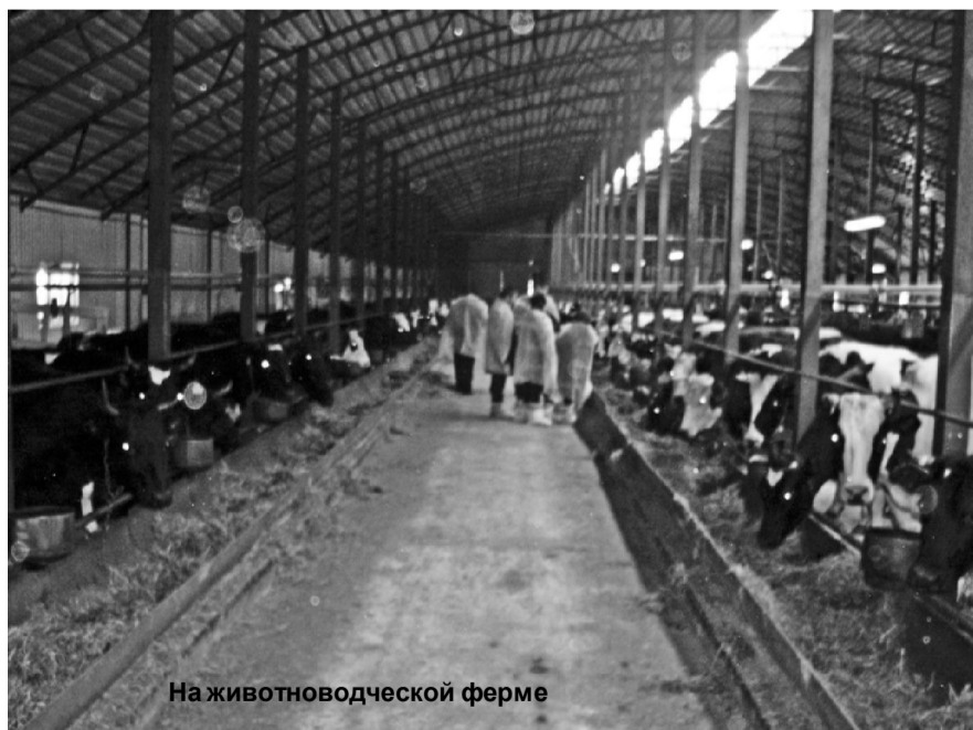
На животноводческой ферме

Современные аграрии подходят к решению многих задач иначе, чем раньше. Сейчас сельское хозяйство очень активно использует технические новинки.