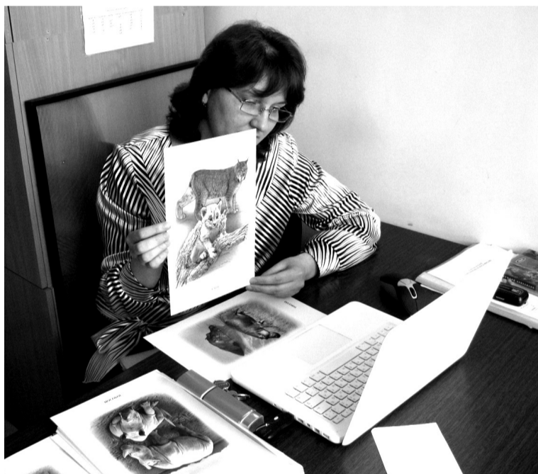
• Сегодня в городском округе организовано восемь рабочих мест для дистанционного обучения детей-инвалидов.