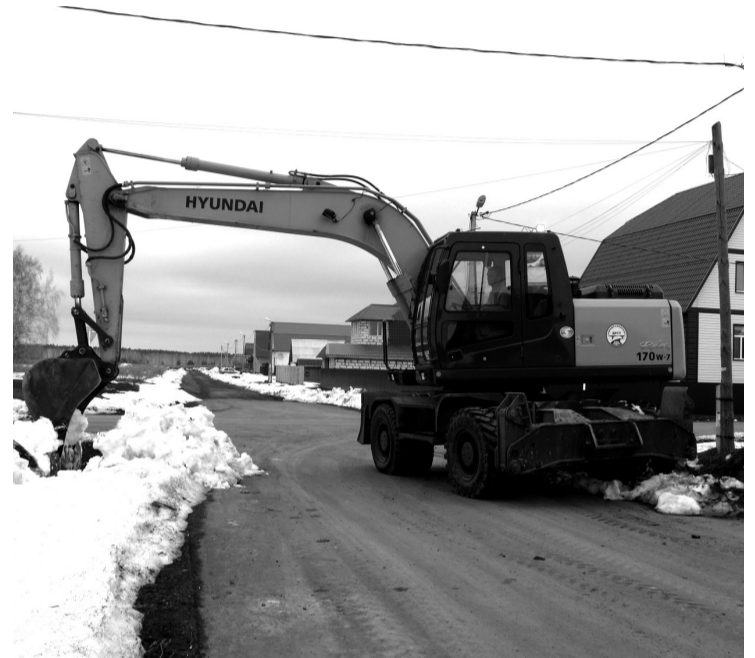
• Улица Земляничная. Очистка кюветов.

Готовы ли мы к паводку? Хотя по прогнозам наша территория не попадает в зону подъёма большой воды, в округе провели подворные обходы и тактические учения вблизи городских и сельских гидротехнических сооружений. Противопаводковые мероприятия отработаны до автоматизма и в случае подтопления не под-