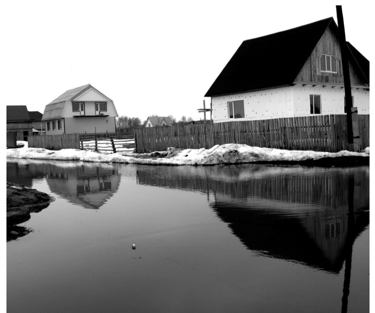
• Перекрёсток улиц Лазурной и Ключевой: вода, кругом вода.

Подготовила Лилия НАЗАРЕНКО