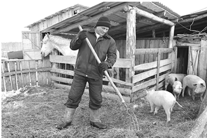
Фото и текст Тамары БЫЧКОВОЙ.

Подрастёт сын, будет легче, а пока главе семьи приходится самому решать насущные вопросы. Так было в семье его родителей, а приучила их к этому Александра Артёмовна Федоренко.