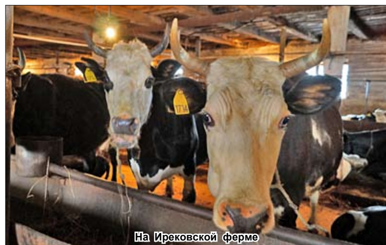
На Ирековской ферме