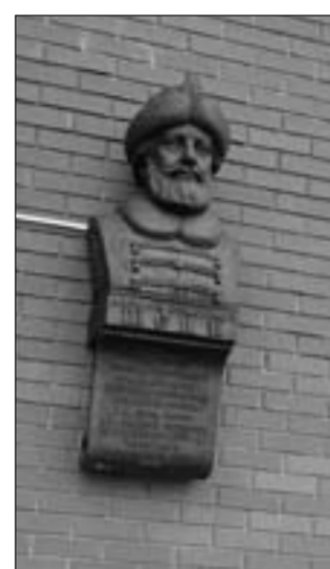
Алексей Шейн, первый русский генералиссимус