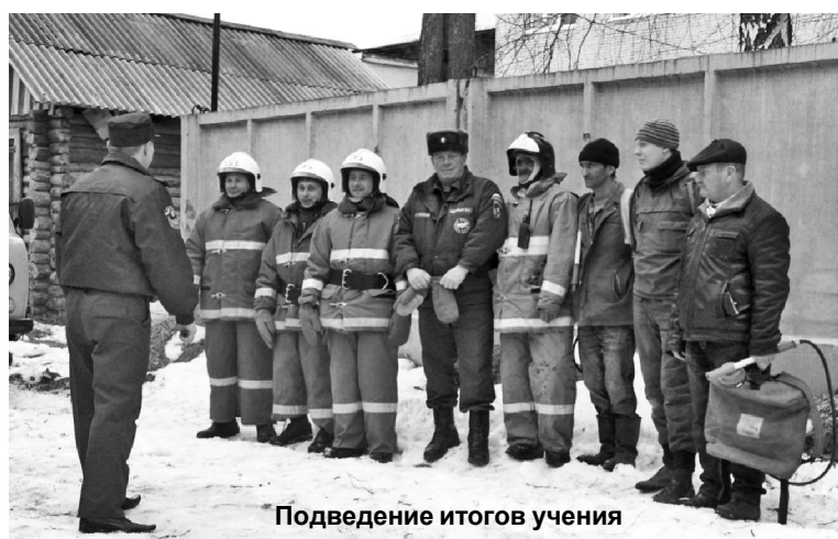
Подведение итогов учения

По легенде условный пожар произошел в лесном массиве возле психоневрологического диспансера. Место «возгорания» было выбрано не случай-