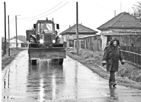
На снимках: во время сбора мусора в Березино