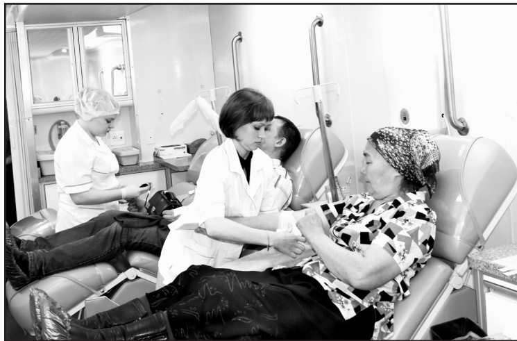
В Юргинском районе прошли дни донора