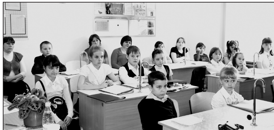
Много юргинских ребят выступили с докладами в третьей секции «Юный исследователь»