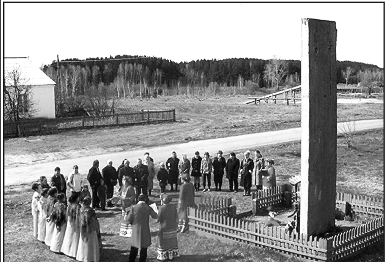
9 Мая 2007 г.

Т.УСОЛЬЦЕВА