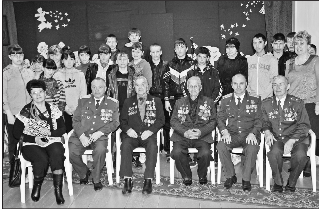
По многолетней традиции ветераны района проводят «уроки мужества» в школах. Недавно такая встреча прошла в Ильинке