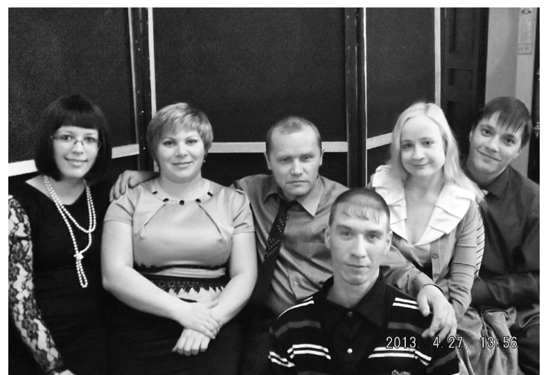
Ребята сплотил не только смех и юмор, но и крепкая дружба.

КВН – это игра, а игра – это удача. К сожалению, улыбается она не всем. Зато фестиваль, которого участники со всего региона всегда ждут с не-