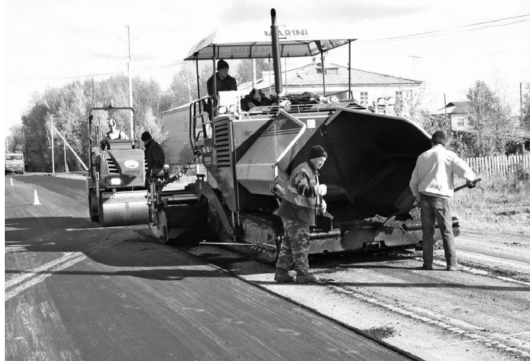
Идет ремонт автодороги