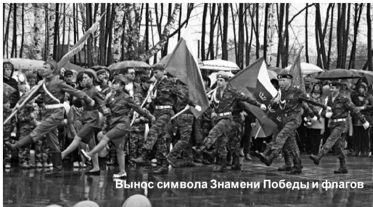
Вынос символа Знамени Победы и флагов

шел проливной дождь. Но, несмотря на это, общая колонна, состоящая из представителей трудовых коллективов, членов партии «Единая Россия» и ЛДПР, в назначенное время отправилась в парк Победы.