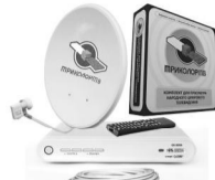
Комплект Триколор ТВ