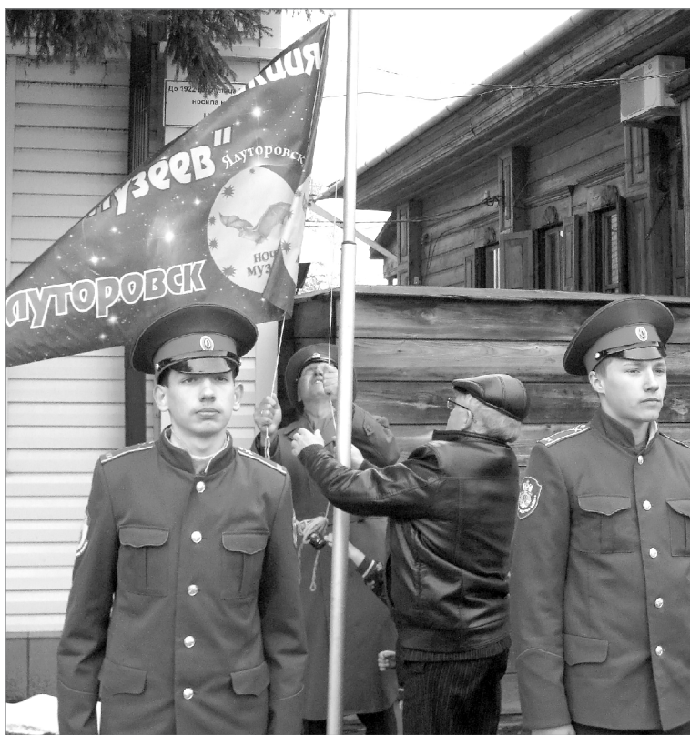
Торжественное поднятие флага акции «Ночь музеев»