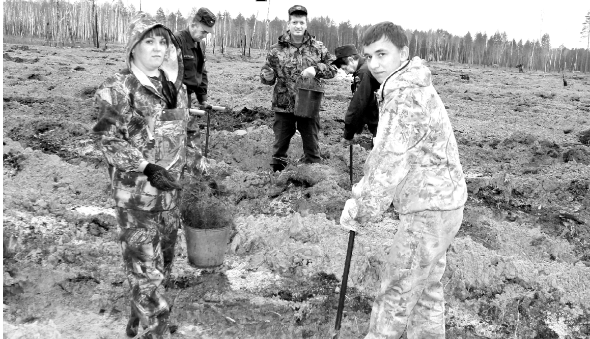
Лесничие и сотрудники МЧС на посадке сосёнок

В прошлую пятницу наш район принял участие во Всероссийской акции «Национальный день посадки леса».