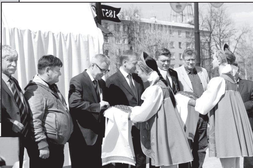
Открытие скеера имени газеты «Тобольская правда»