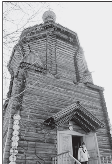
Деревянная церковь Илии Пророка

Введено в эксплуатацию 19 тысяч квадратных метров жилья, 17 тысяч – за счёт индивидуальных застройщиков. Подошло к концу строительство линейной части градораспределительной станции посёлка Демьянка и местного га-