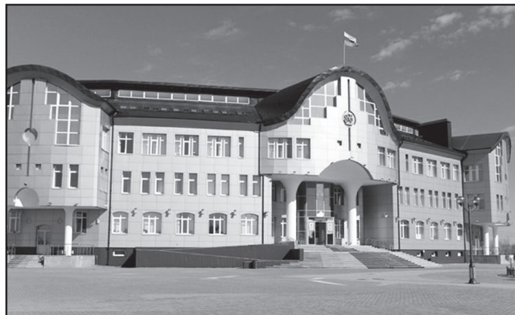
Уват. Здание районной администрации

просматривается контур ещё более изысканного сооружения в виде корабля. Здание районной администрации и центральная площадь, украшением которой являются солнечные деревянные скульптуры здешних, северных и зарубежных талантливых мастеров, участников международных фестивалей, которые, кстати сказать, проходят традиционно не только в Салехарде, но и в Увате тоже. Биатлонный центр имени Александра Тихонова, который принимает спортсменов мирового уровня.