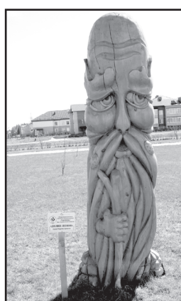
Фестиваль деревянной парковой скульптуры