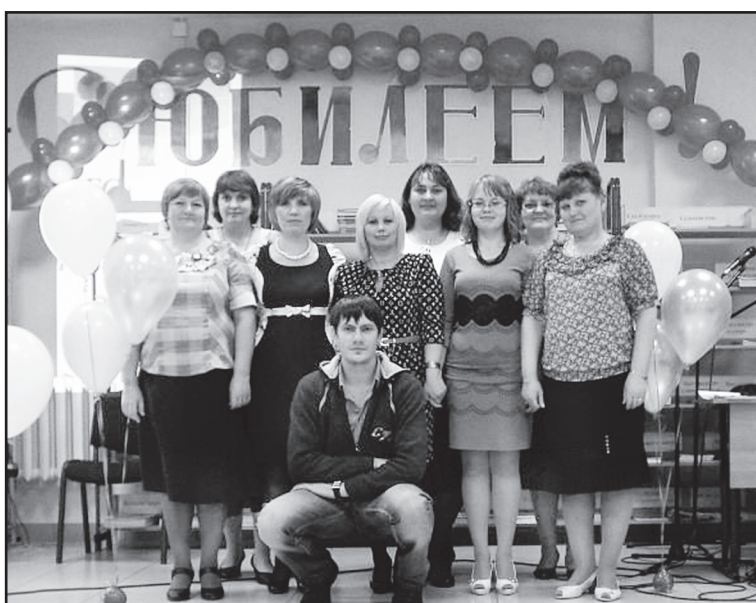
Коллектив Центральной районной библиотеки

Меняется внутреннее содержание библиотек. В прошлое уходит читальный зал, так как те же справочники и энциклопедии