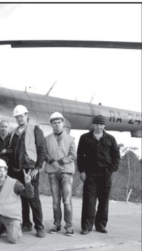
На вертолётной площадке