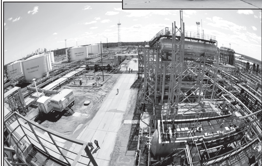
Уват имеет достаточно высокие перспективы нефтедобычи

Проезжая по улицам нового Увата, я была поражена масшта-