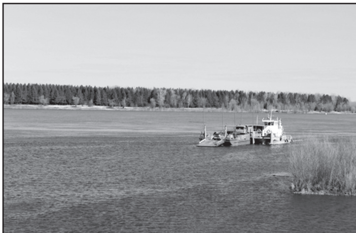
Паромная переправа через р. Иртыш