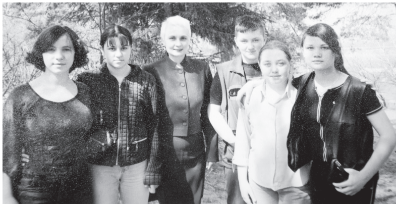
Кружок юнкоров при детском костно-туберкулёзном санатории.