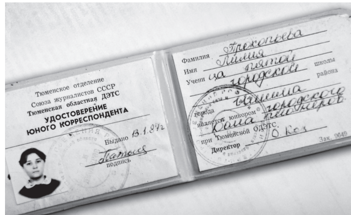
Бережно хранимое удостоверение юнкора.