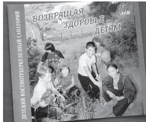
Детский костно-туберкулёзный санаторий