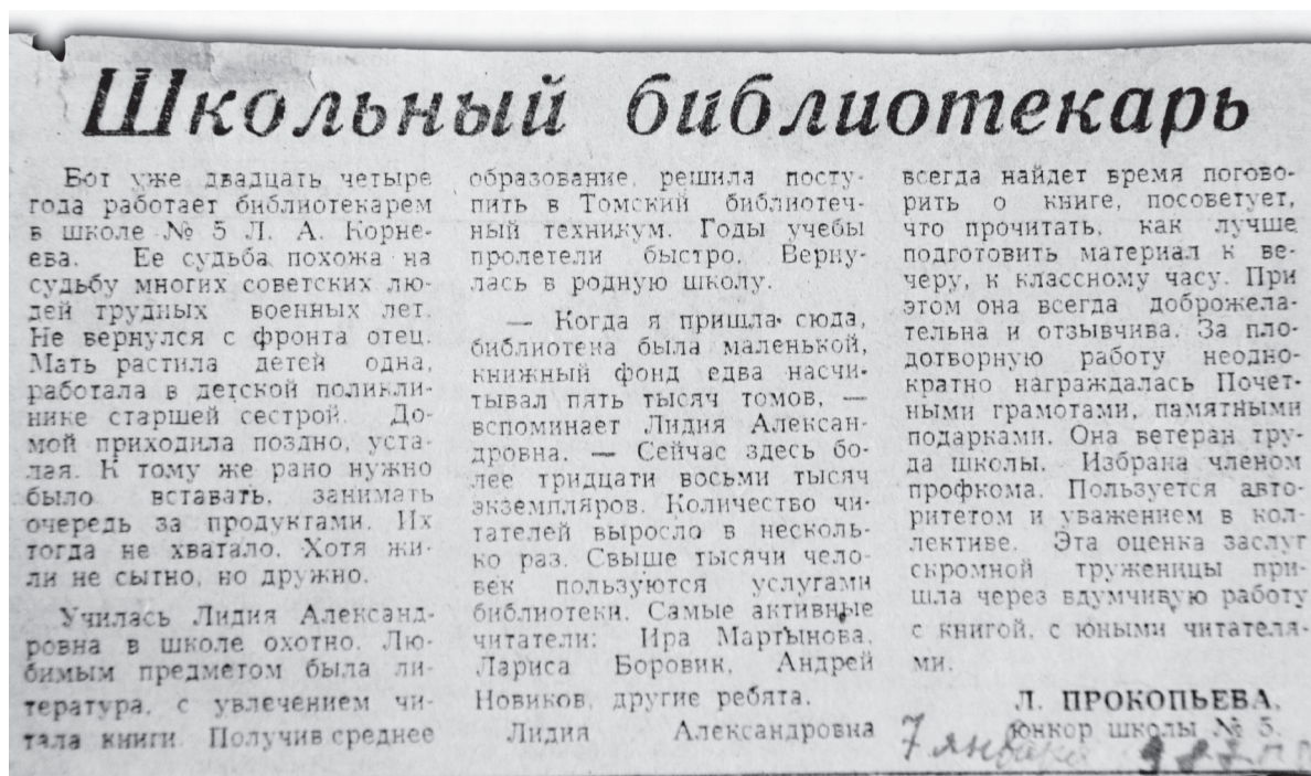
Одна из первых публикаций на страницах «Ишимской правды».