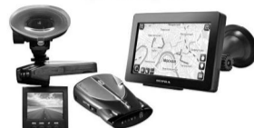
Автоэлектроника: навигаторы, видеорегистраторы, антирадары