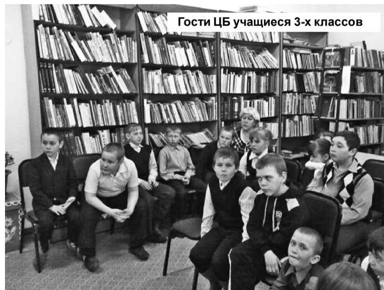
Гости ЦБ учащиеся 3-х классов

«Пришло мирное время, но шрамы той войны остались в каждом городе и селе. Созданы мемориальные комплексы, места боев отмечены обелисками, памятники с красными звездами хранят имена погибших бойцов. Невозможно забыть те великие бедствия, которые война принесла нашей стране, нашему народу. Мы знаем, какой це-