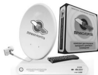
Комплект Триколор ТВ