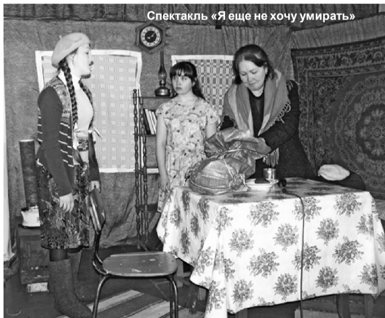
Спектакль «Я еще не хочу умирать»