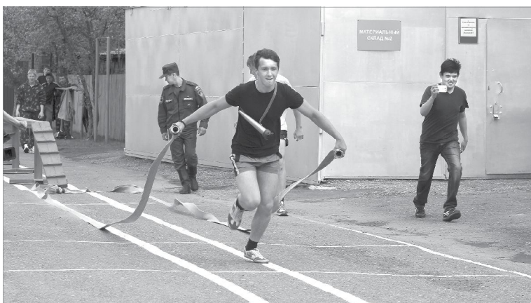
С пожарными рукавами - на скорость!