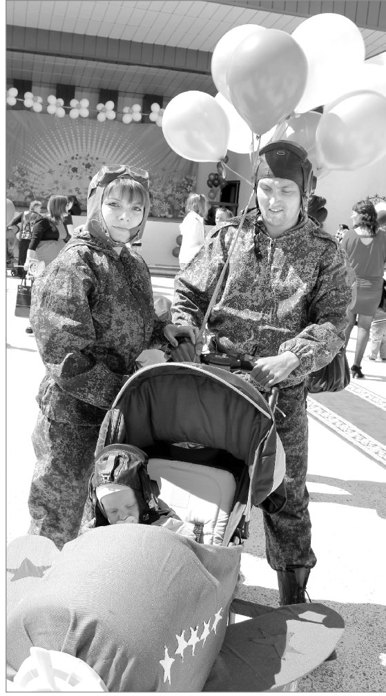
Лётный экипаж: в коляске - командир