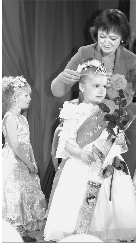
Победительнице - корону!

Граждане, среди которых было немало учащихся и сотрудников филиала нефтегазового университета, высказали дельные предложения о дальнейшем укреплении правопорядка в микрорайоне и досуге молодёжи. А также выразили слова благодарности своему участковому за его работу: «Он всегда с нами, присутствует на всех мероприятиях, организует спортивные игры и соревнования с ребятами, водит их на различные секции, они прыгают с парашютом... Словом, нашёл общий язык с подростками», - отметили посетители участка. Валентина ЕФИМЕНКО