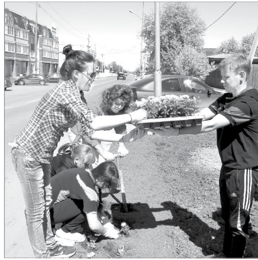
Посадка цветов - тоже наука