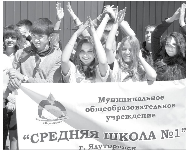
К работе готовы!