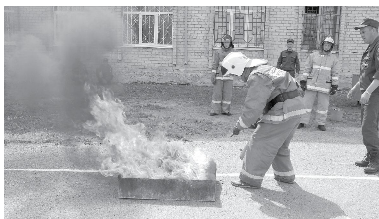
Пара секунд - и огонь потушен

Участники спартакиады соревновались в эстафете, выполняли боевое развертывание, показывали умение преодолевать препятствия, обращаться с пожарными рукавами и брандспойтом, тушить открытый огонь. С заданием справились все команды. Однако луч-