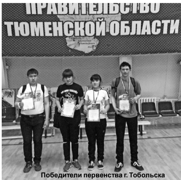
Победители первенства г. Тобольска