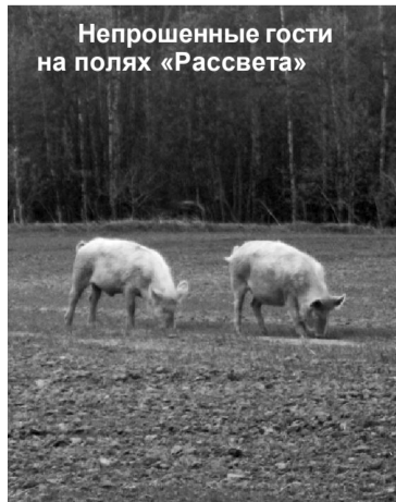
Непрошенные гости на полях «Рассвета»