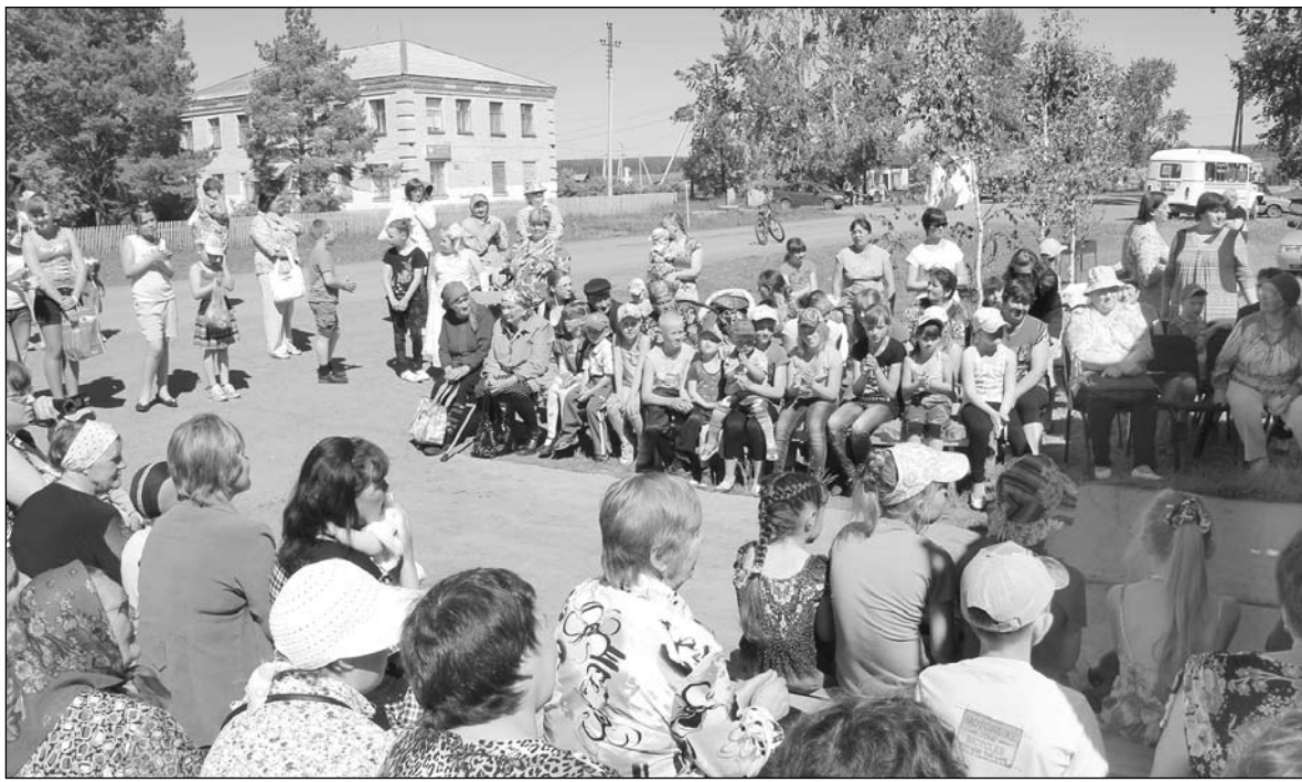
Празднование юбилея района в Боровлянском сельском поселении

– С 90-летием Голышмановского района пришли поздравить друг друга, можно сказать, все жители посёлка Ламенский. С самого утра у нас работали детские игровые и спортивные площадки, где активно участвовали дети и взрослые. В фойе Дома культуры были оформлены выставки: одна посвящена долгожителям нашего посёлка, вторая – истории Голышмановского района. На торжественном мероприятии поощряли людей, отличившихся в