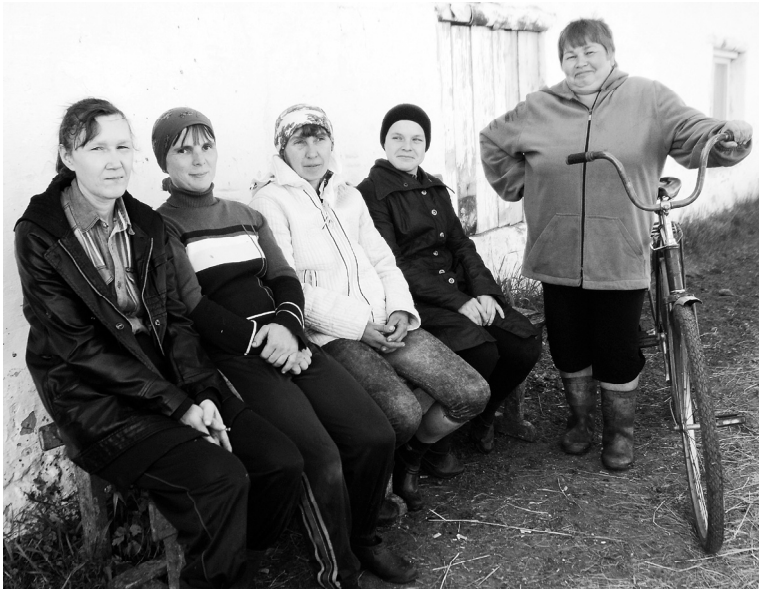
Операторы машинного доения СПК «Победа»

Закончился сев зерновых и зернобобовых культур. Внимание хозяйств, где есть животноводство, переключается на заготовку кормов. Короткое в Сибири лето. Это сейчас пастбища представляют собой зеленый, сочный ковер травы, который скот с удовольствием поедает. Придет время, зелень потеряет свою кормовую ценность. Так что о предстоящей зимовке думать надо уже сейчас.