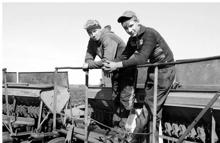
Помощники на посевной