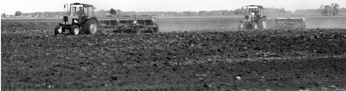
На будущий год здесь будет сенокос