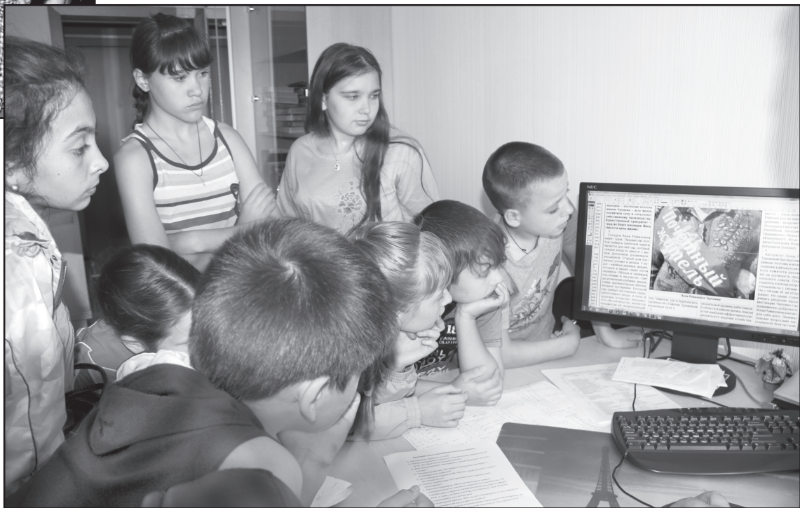
Экскурсия по Дому прессы