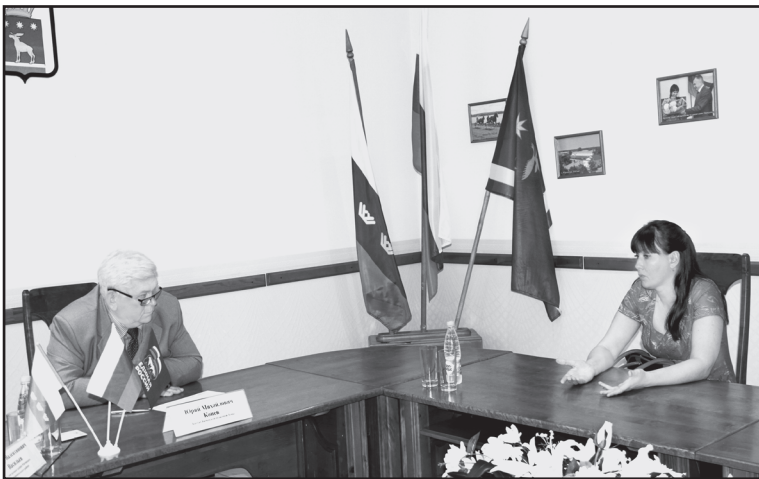
В депутатской приёмной

известно, после десяти – пятнадцати лет работы, не раньше. И лучше если молодой специалист пройдёт этот профессиональный путь под патронажем опытных наставников, у которых есть чему поучиться.