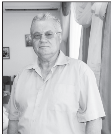
Помощник депутата В.Г. Скалыга

праздником, поделился хорошей новостью: 636 тысяч рублей из депутатского фонда выделено на приобретение оборудования и мебели для детского отделения. Для больных учреждение здравоохранения – это надежда и вера. Они входят туда с особым чувством. И хотя, чтобы здесь было всё самое лучшее.