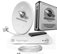
Комплект Триколор ТВ