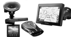
Автоэлектроника: навигаторы, видеорегистраторы, антирадары