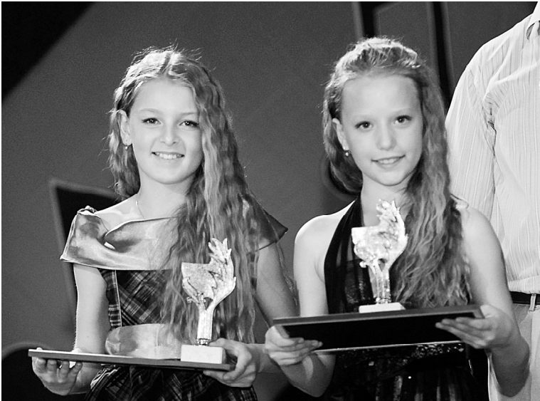
Обаятельный дуэт «Маша+Даша», лауреат I степени