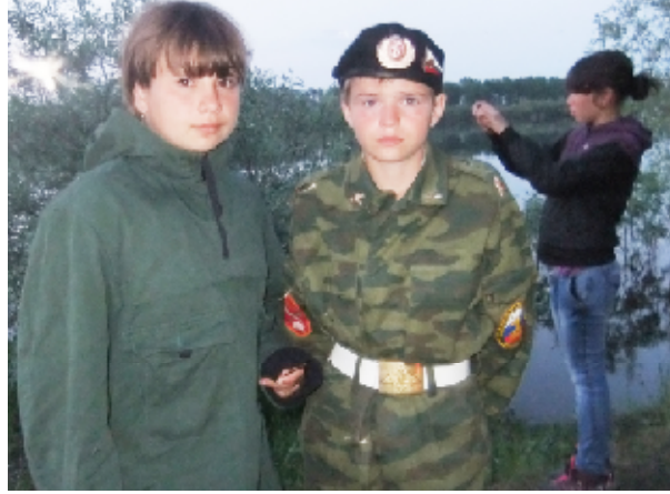
У кадетов и краеведов общие разговоры

- Раньше я не понимала, людей, которые плакали, слушая военные песни. А после экспедиции моё отношение к жизни изменилось. Я осознала, что кто-то ради нас умирал. Мне не