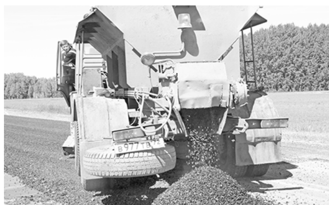
* Работает техника