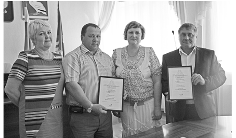
* Церемония награждения