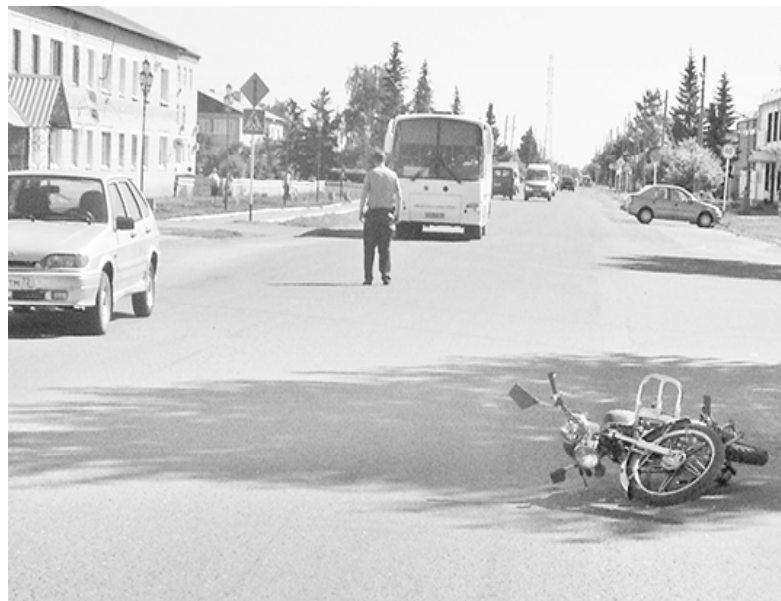
* ДТП в с.Сладково

Записала Анастасия ГАЦАЕВА