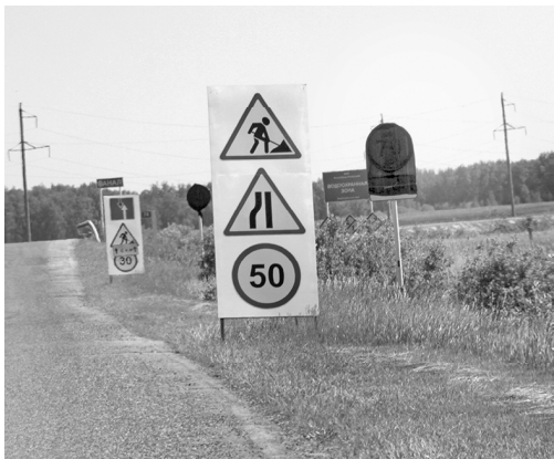
* Знаки обязательны

Анастасия ГАЦАЕВА