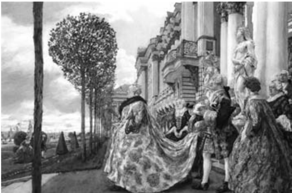
Елизавета Петровна в Царском Селе (с картины Е. Лансере)

ние здоровья её резко ухудшилось ещё в 1757-м. По крайней мере, большинство мемуаристов свидетельствует, что именно тогда у Елизаветы к давним эпилептическим припадкам («наследство» батюшки) добавились тяжелейшая одышка, отечность и носовые кровотечения. На ногах царственной особы нередко открывались кровотокающие язвы трофического свойства.