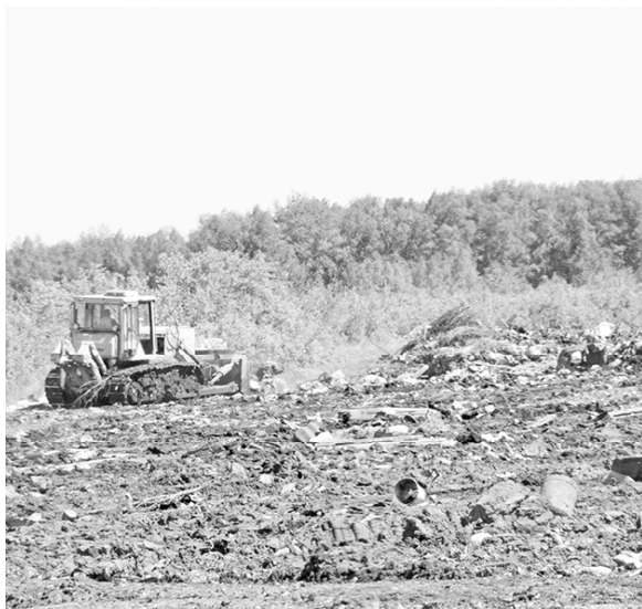
* Буртование мусоросвалки