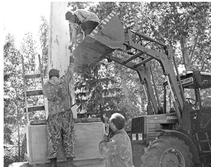
* Реконструкция обелиска в Вознесенке