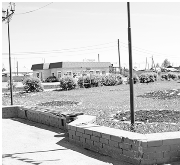
* Цветник в центре посёлка