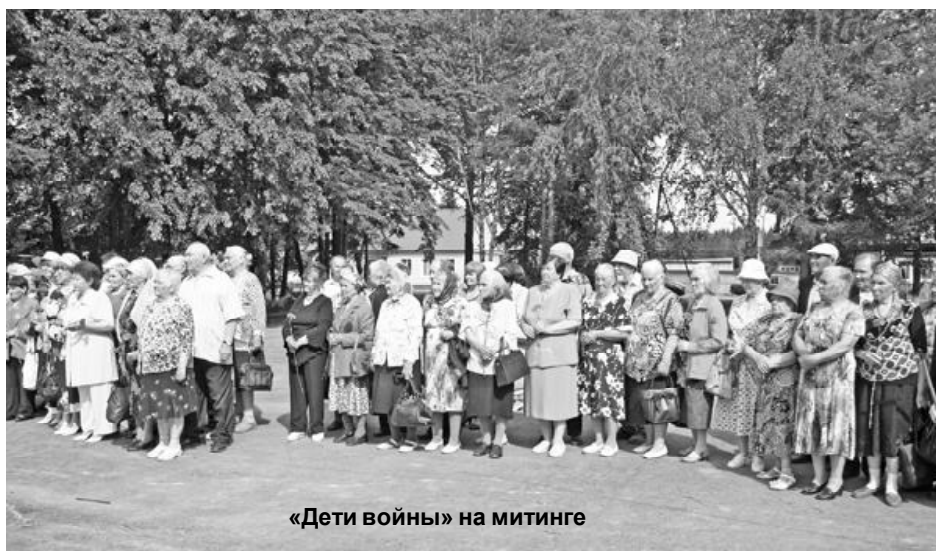
«Дети войны» на митинге

Все началось с митинга у памятника воинам, погибшим в годы Великой Отечественной войны, возложения венков и цветов. В районном Дворце культуры продолжи-