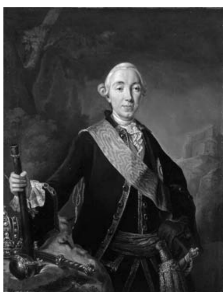
Парадный портрет Петра III работы Л.К. Пфандцельта

Её же окружением пущен слух о мужской несостоятельности Петра, непотистическим образом затем трансформировавшийся в легенду о его же развращённости. Впрочем, то, что именно Пётр Фёдорович стал в 1754 году отцом их ребёнка (будущего Павла I) Екатериной не отрицала – ненавидимый ею