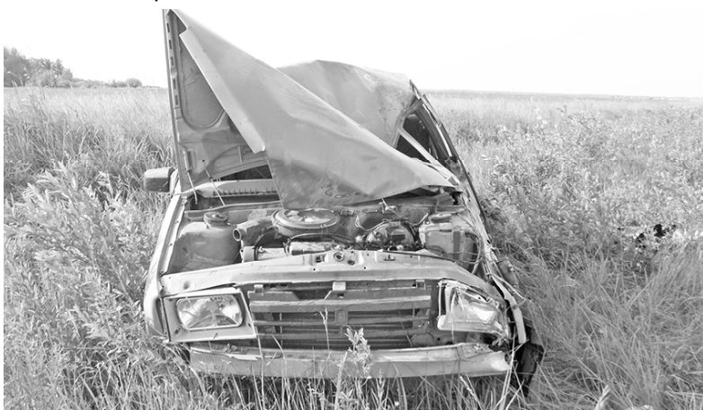
*То, что осталось от «девятки»

Анастасия ГАЦАЕВА