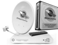
Комплект Триколор ТВ