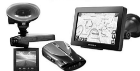
Автоэлектроника: навигаторы, видеорегистраторы, антирадары