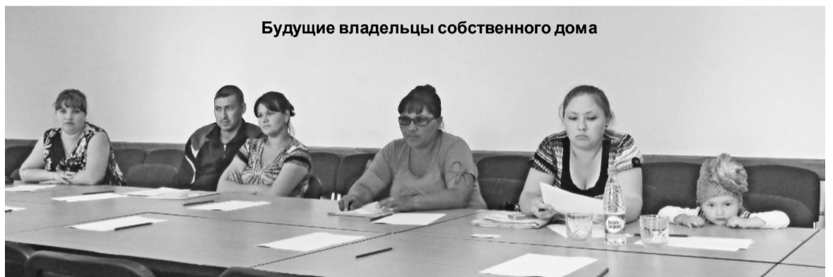
Будущие владельцы собственного дома

Ответить положительно на этот вопрос теперь просто обязаны семьи – участники федеральной целевой программы «Жилище», которые утверждены в основном списке на получение свидетельства в текущем году.