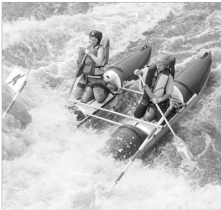
На сплав по реке отважатся только сильные духом