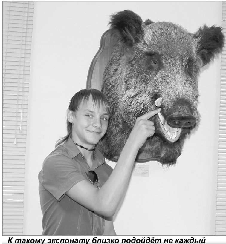
К такому экспонату близко подойдёт не каждый