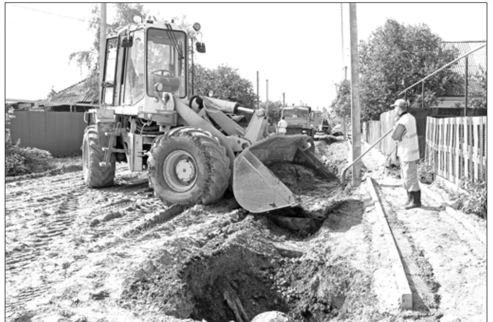
Идут работы на улице Маяковского