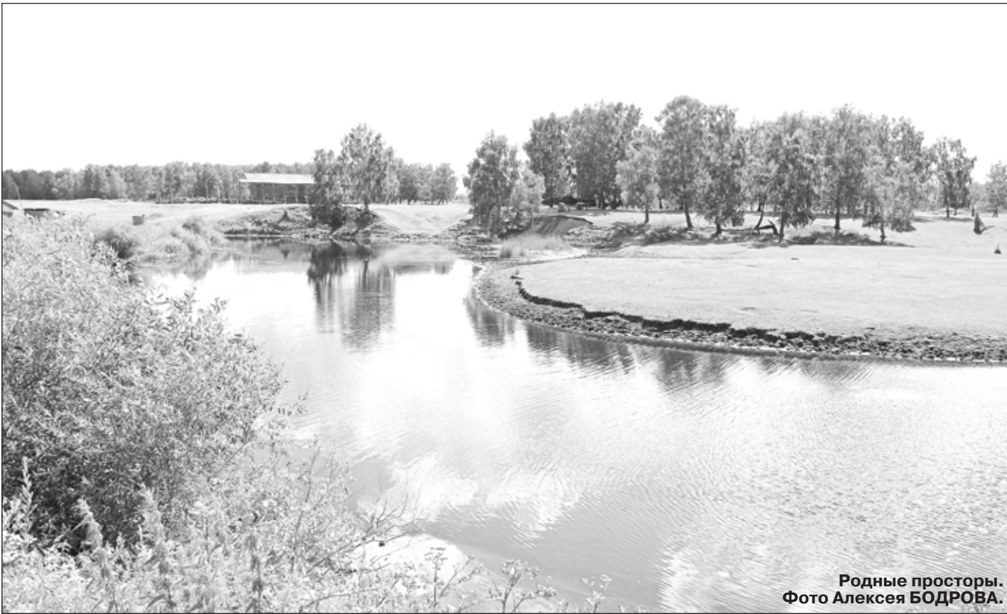
Родные просторы.