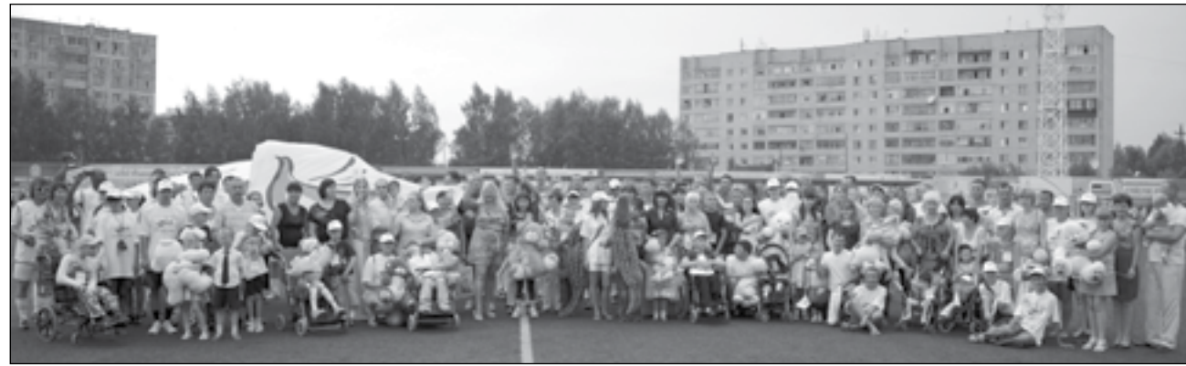
(Окончание. Начало на 1 стр.)

Кстати, волонтеры охотно выезжают на предприятия, работники которых намерены коллективно поддержать акцию.