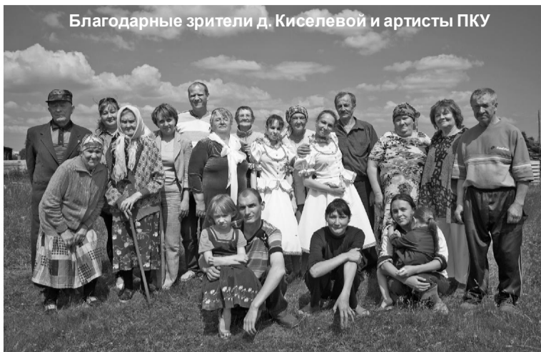
Благодарные зрители д. Киселевой и артисты ПКУ