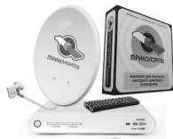
Комплект Триколор ТВ