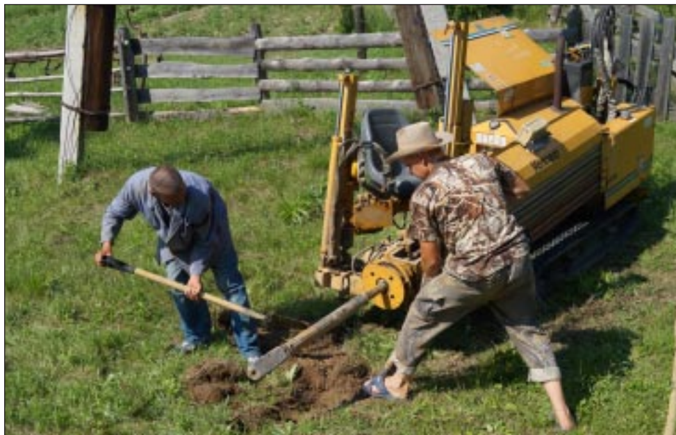
Укладка трубы бестраншейным способом в с. Демьянское.