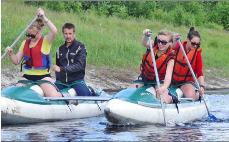
Заплыв на катамаранах

ский экстрим» в Надцах. Кто бы мог представить, но в программе были однодневные выходы в дикую, ни кем не тронутую природу заказника регионального значения «Тобольский материк», преодоление туристской полосы препятствий, катание на байдарках и гребных катамаранах, рыбалка и, конечно же, проживание в настоящих туристских палатках.