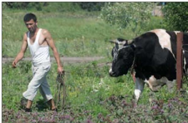
Племенной бычок - перспективная покупка

Трудно было не заметить, что в районе фермы вместо бурьяна - россыпь рулонов сена на зелени луга. Это урожай люцерны и тимомеевки. А за деревней уродился хороший ко-