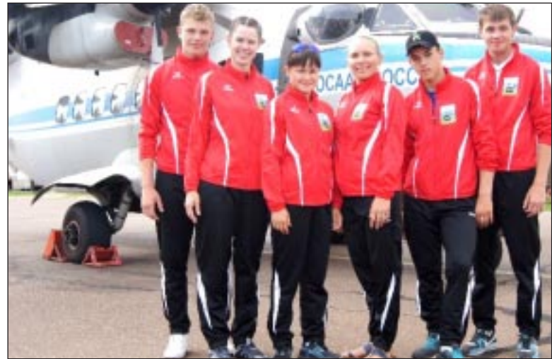
Команда парашютистов Уватского района.

Владимир НАСЫРОВ Фото из архива АНО «АТСК «Высота»