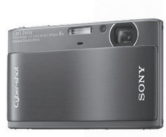
Фото и видео