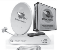
Комплект Триколор ТВ