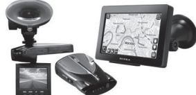
Автоэлектроника: навигаторы, видеорегистраторы, антирадары