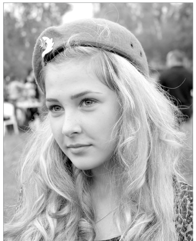
Жаль, девчонок в ВДВ не берут...