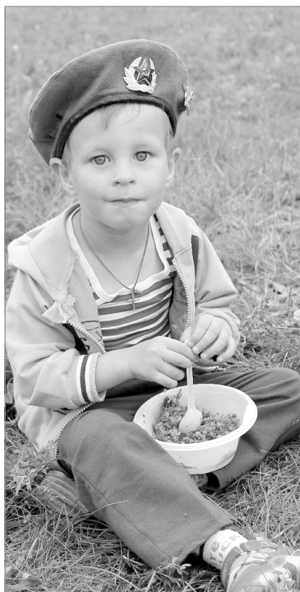
Подрастай, новая смена!