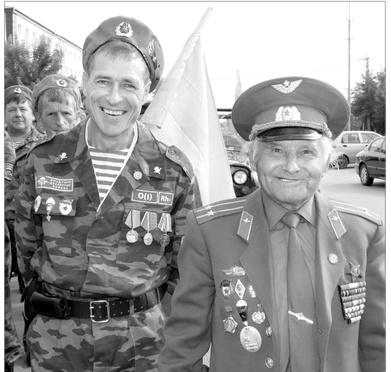
Поклон прошлому. Честь - настоящему