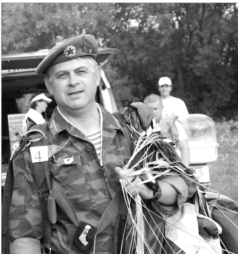
С высоты на «ты»