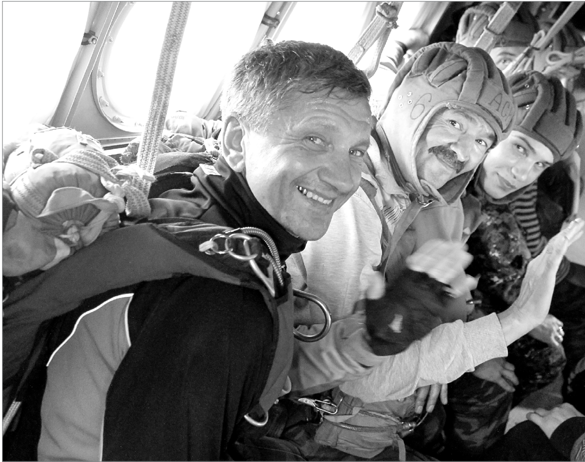
Перед прыжком в бездну. Настроение отличное

Город и район отпраздновали День Воздушно-десантных войск