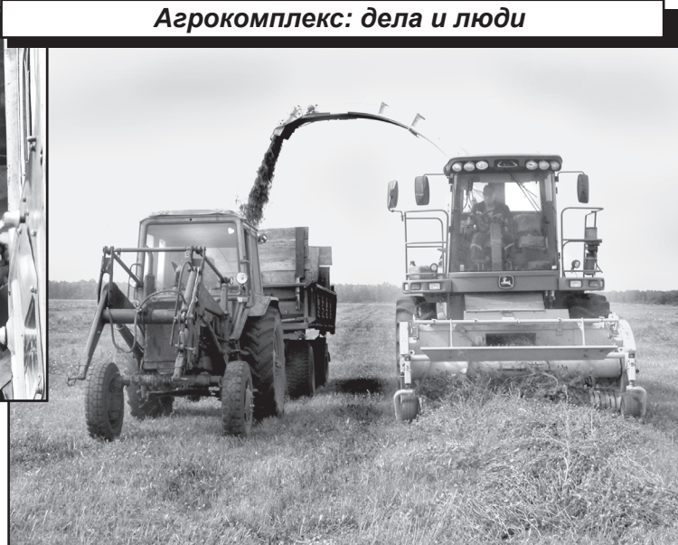
Агрокомплекс: дела и люди